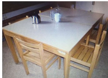
H : 76-L : 120-l : 80cm